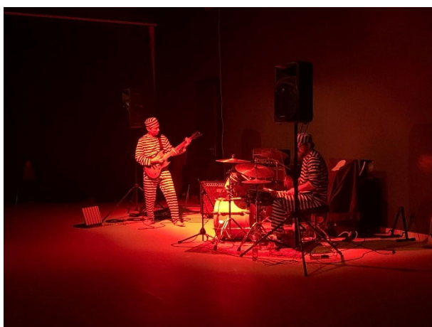
Fête de la Musique 21.06.2023 Salle polyvalente du Bled